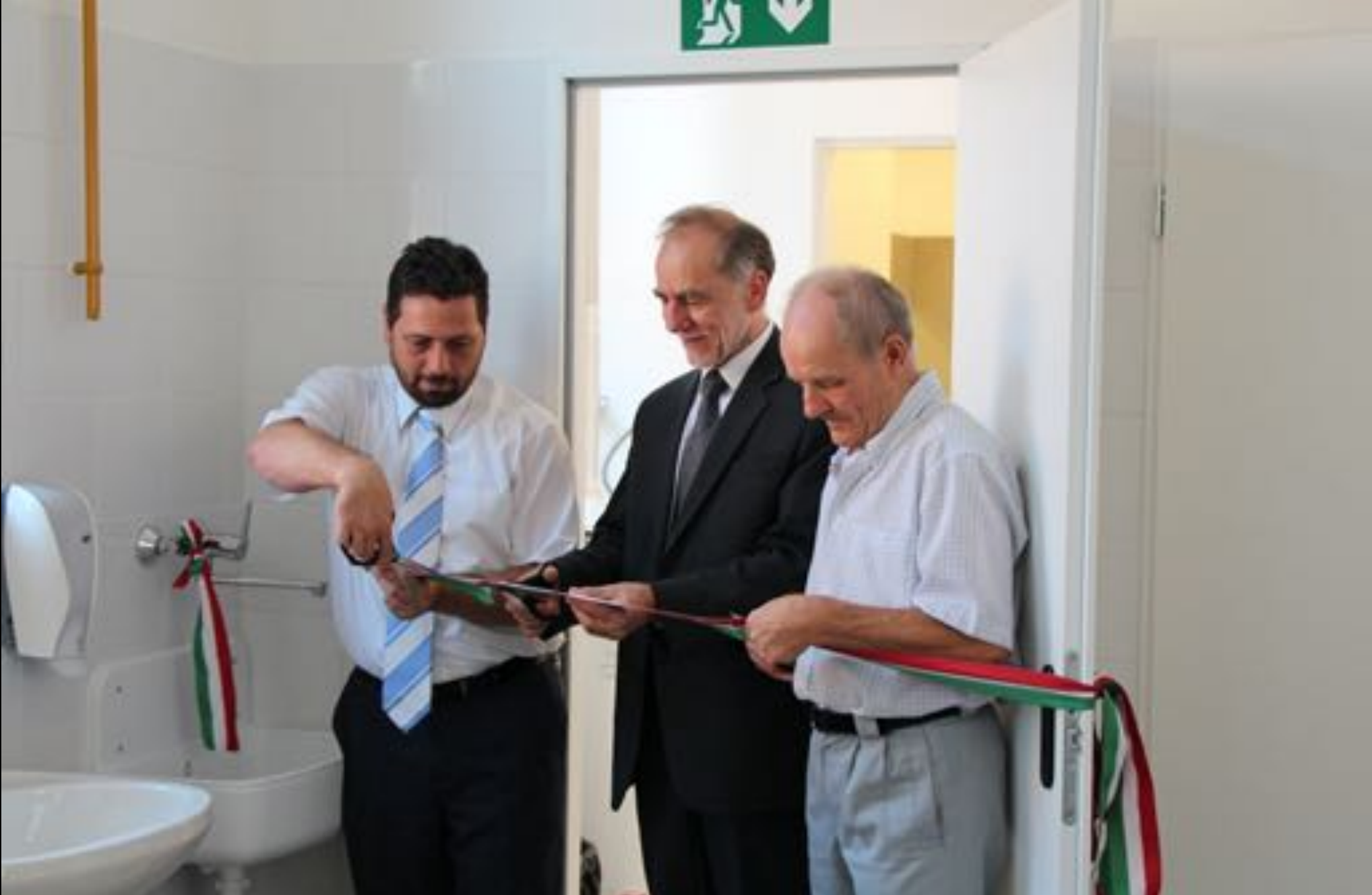
2019. augusztus 28. Vásár téri iskola melegítőkonyha átadás