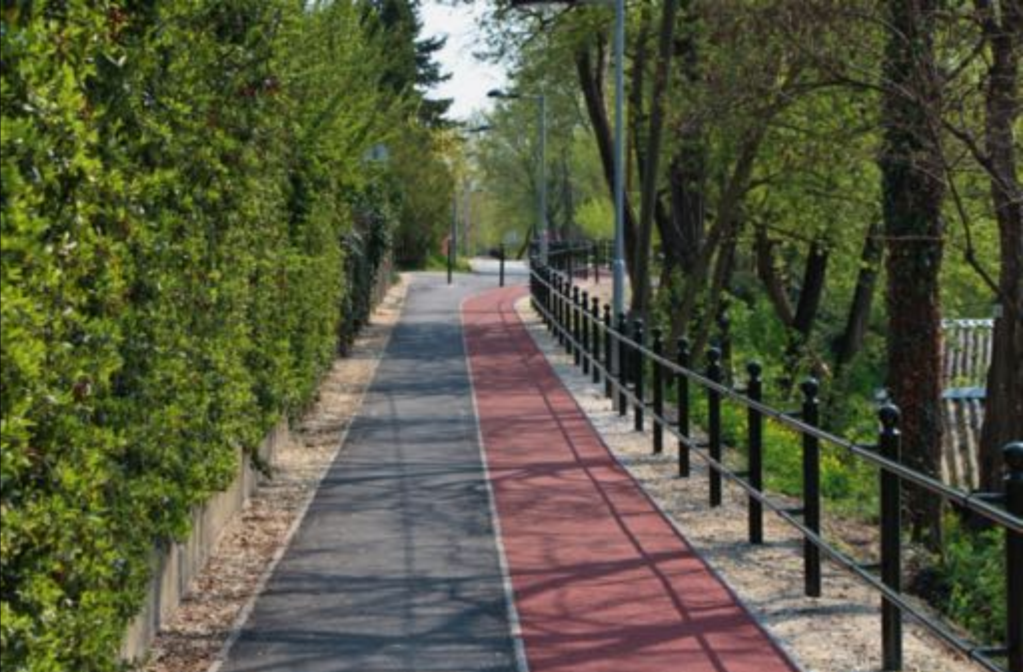
2018. november Nagy-tó körüli sétány és futópálya építése útkorrekcióval