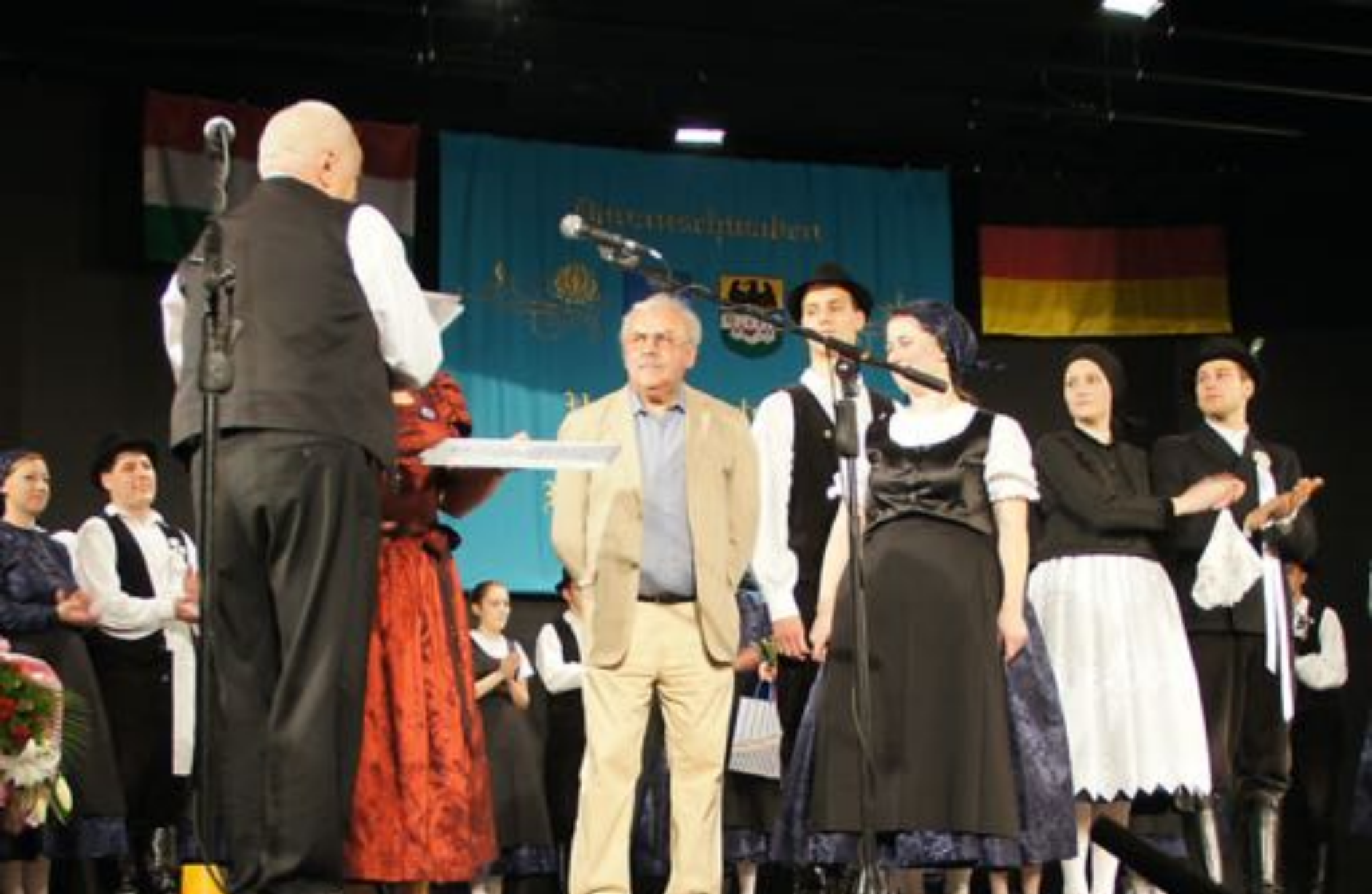
2014. október 25. A Német Nemzetiségi Táncegyüttes fennállásának 60. évfordulója