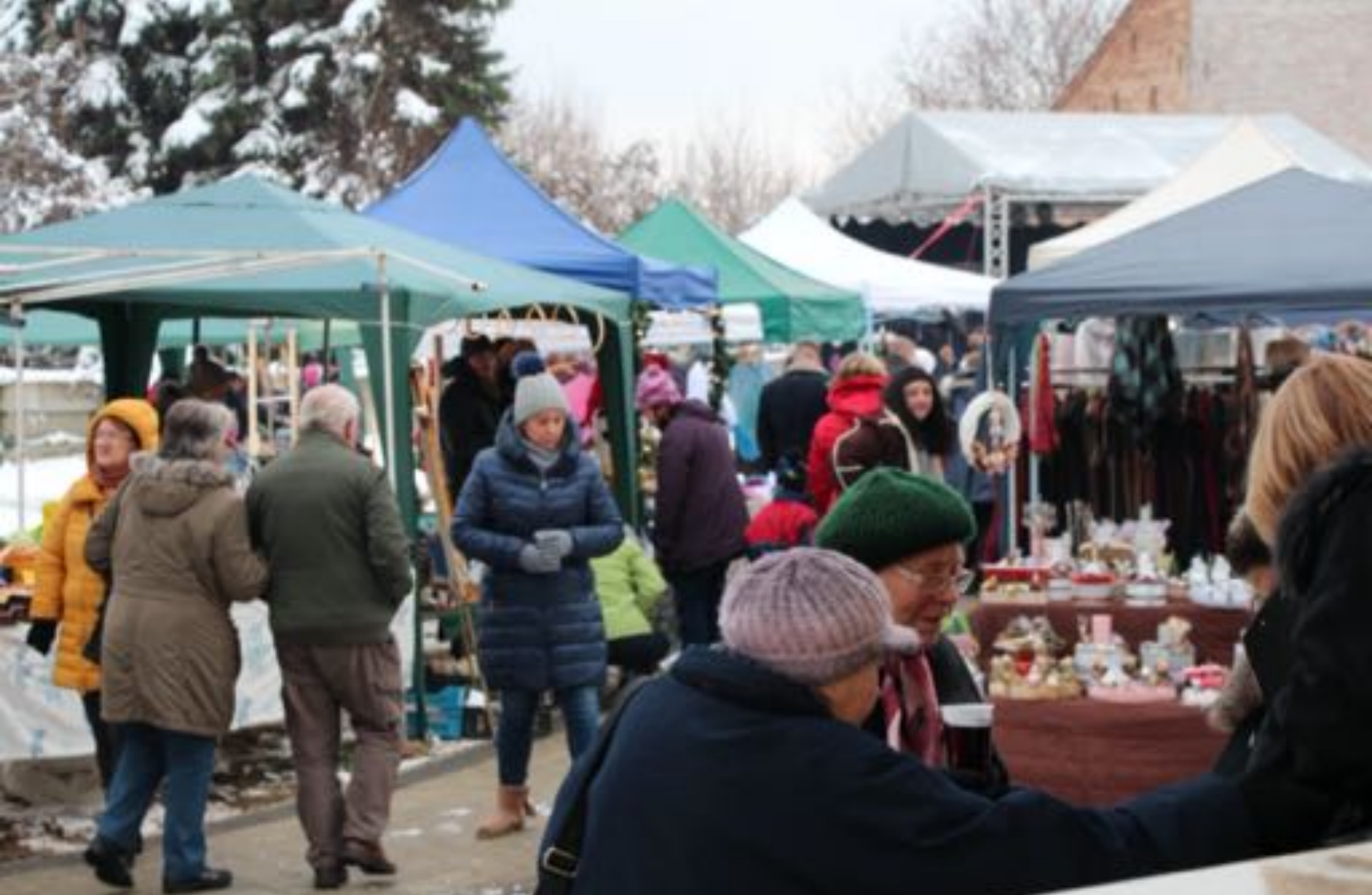
2018. december 16. Adventi vásár (új helyszínen)