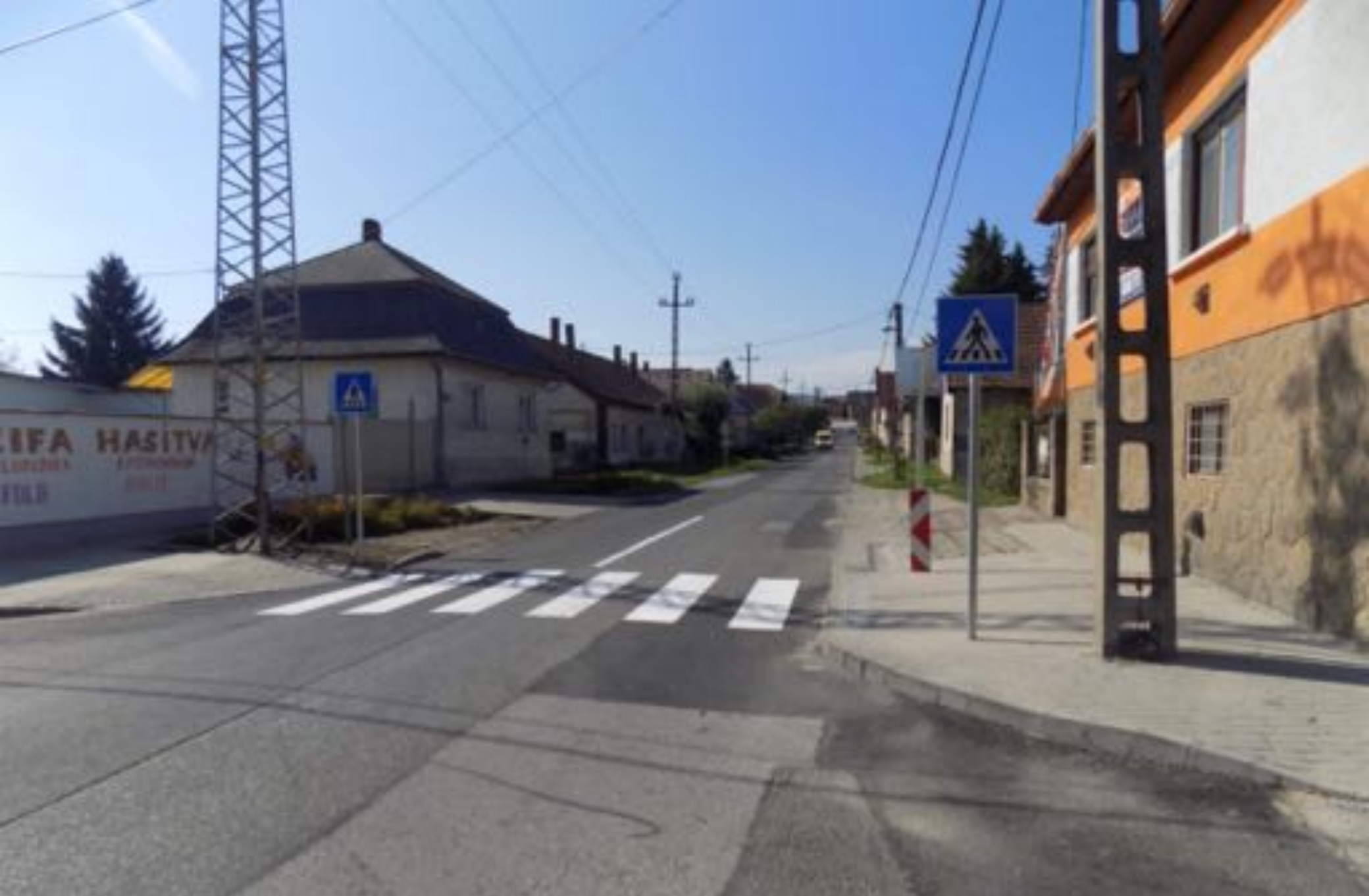
2016. szeptember Gyalogátkelő a Csobánkai utca - Madách utca kereszteződésénél 2 668 778 Ft