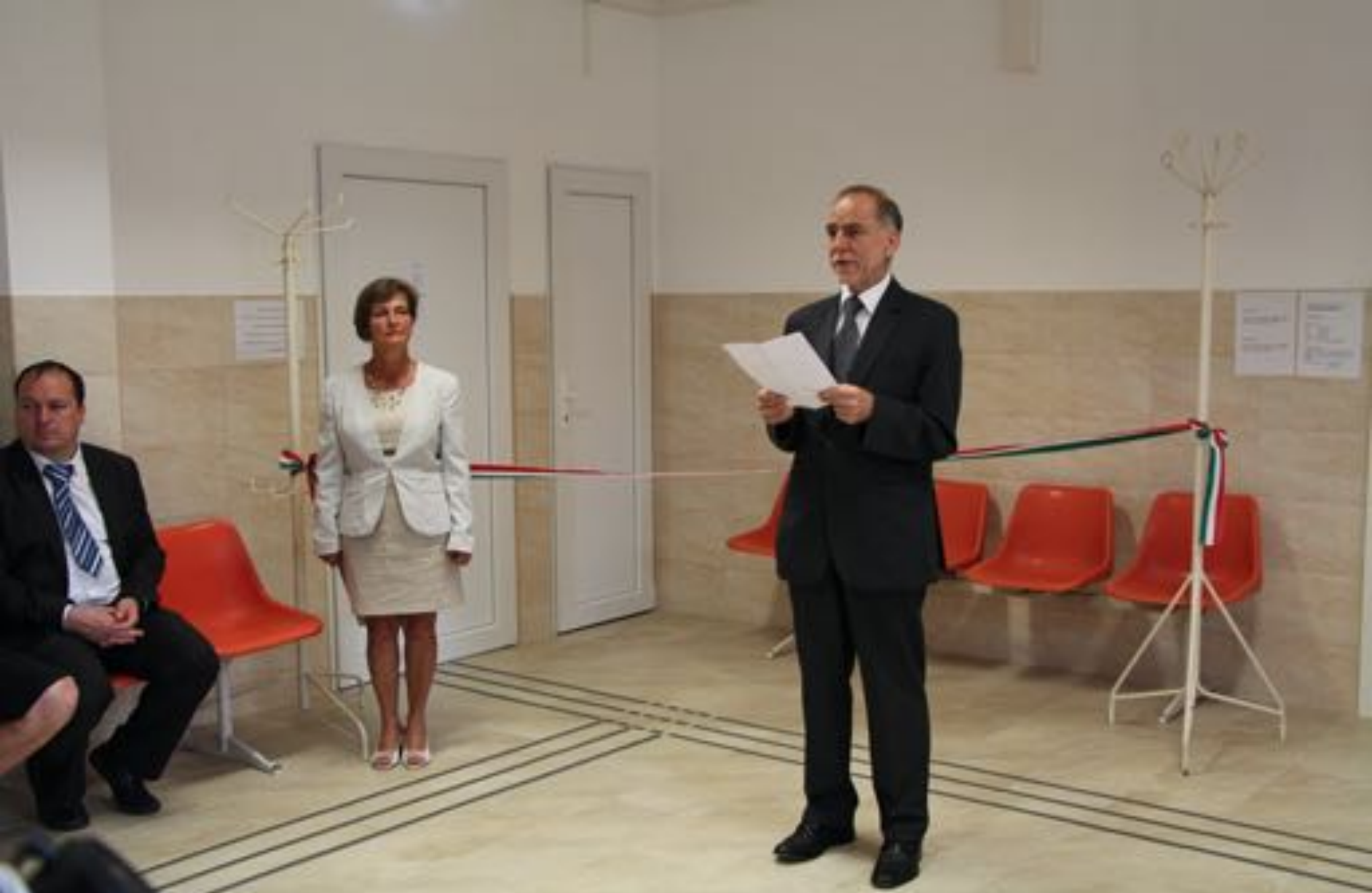
2019. augusztus 8. Felújított háziorvosi rendelők átadása