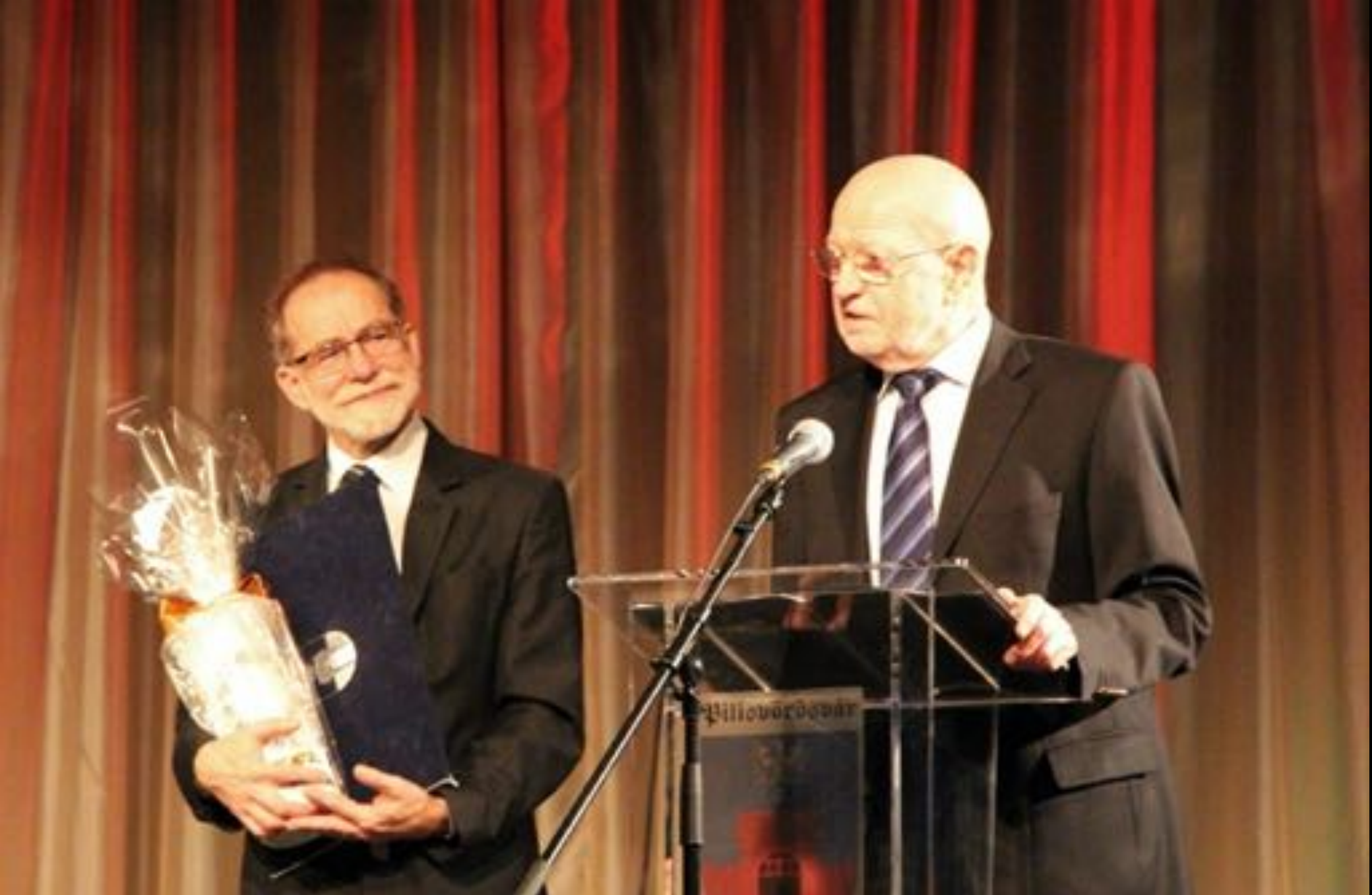
2018. október 23. Díszpolgári cím és Pilisvörösvárért emlékérmek adományozása