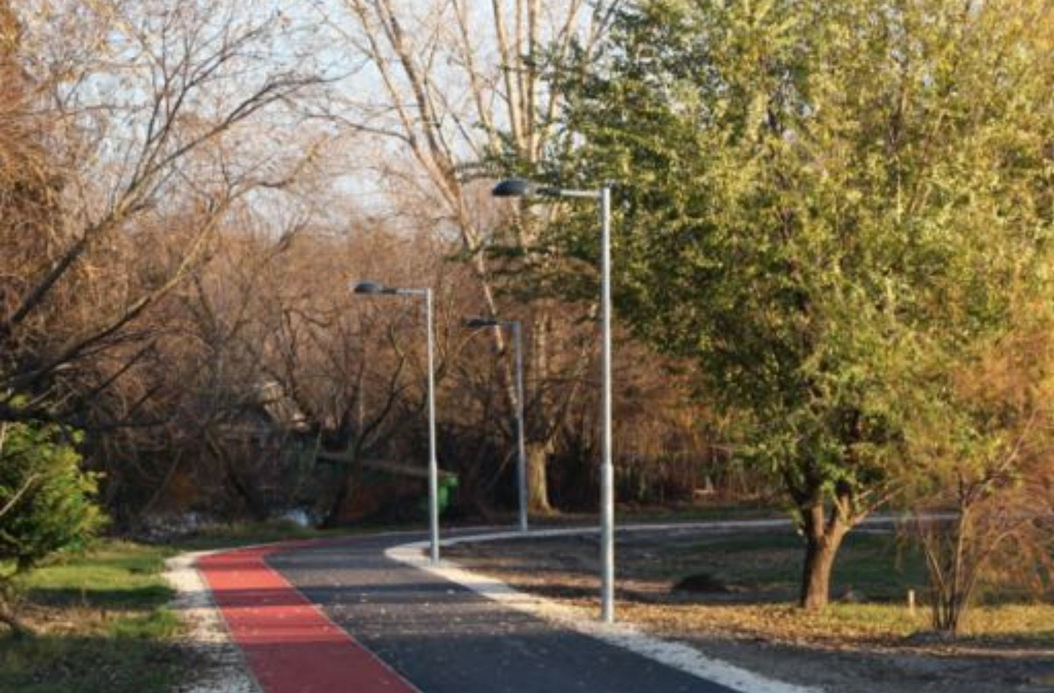
2018. november Nagy-tó körüli sétány és futópálya építése útkorrekcióval 140 004 946 Ft