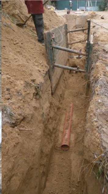
2015. augusztus Csatornahálózat-bővítés (11.294 fm hossz, 351 db ingatlanbekötés) 429 090 979 Ft