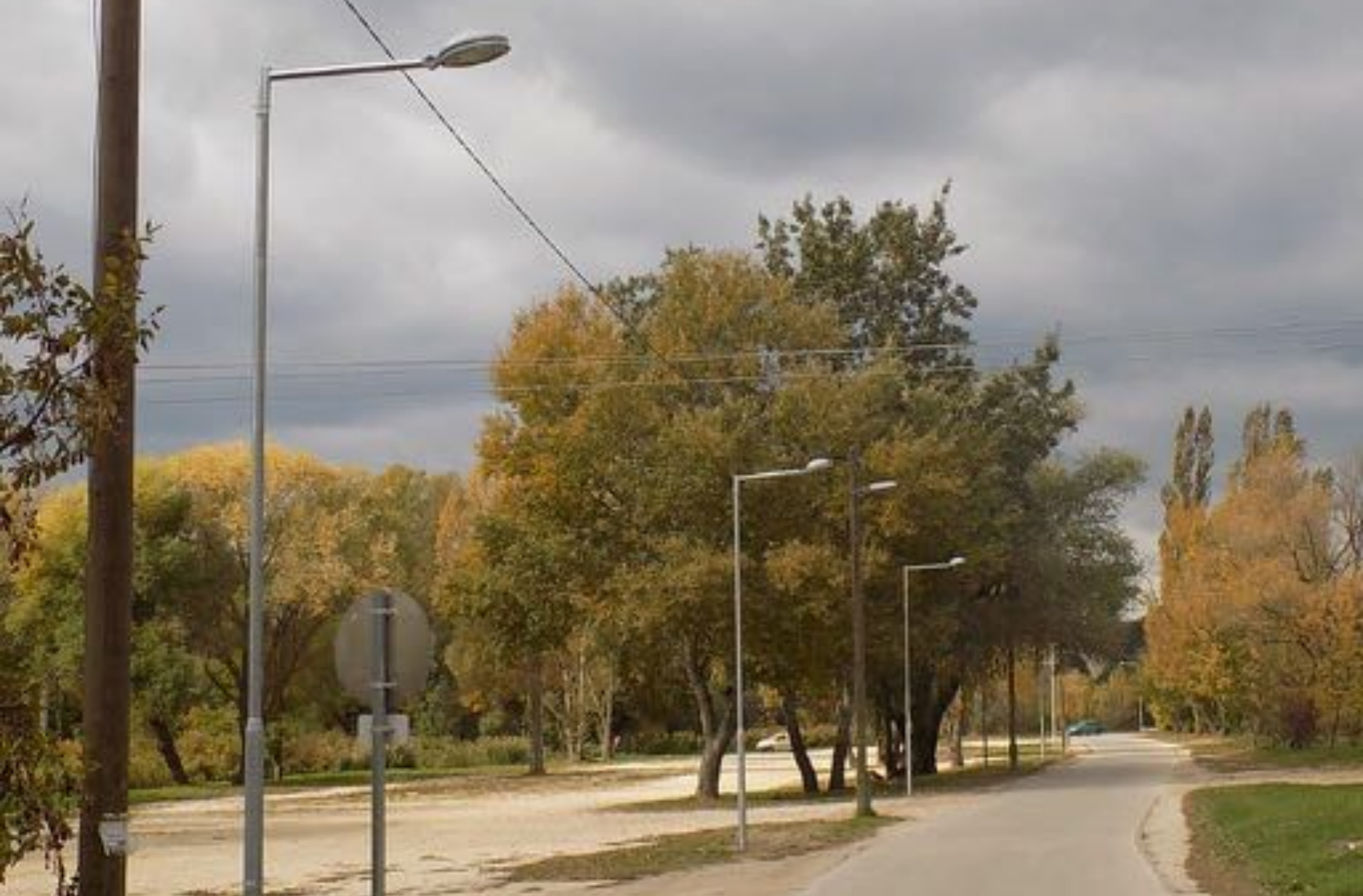
2017. október Városliget sétány: kandeláberes közvilágítás kiépítése 14 383 003 Ft