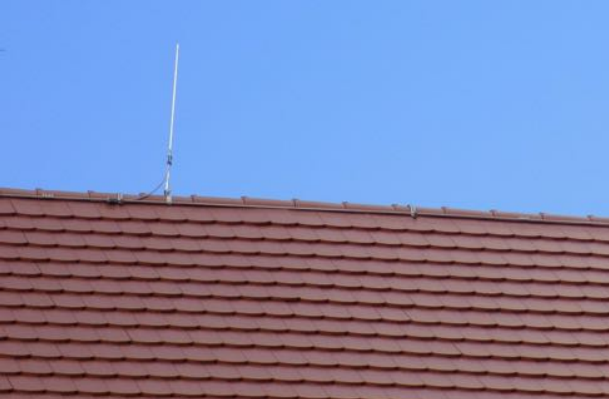
2016. november Villámvédelmi rendszer felújítása a két általános iskolában 6 433 750 Ft