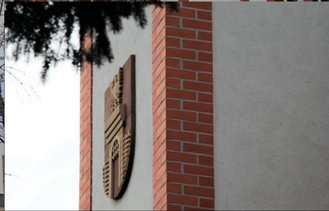
2017. november Szakorvosi rendelőintézet energetikai korszerűsítése 39 957 248 Ft