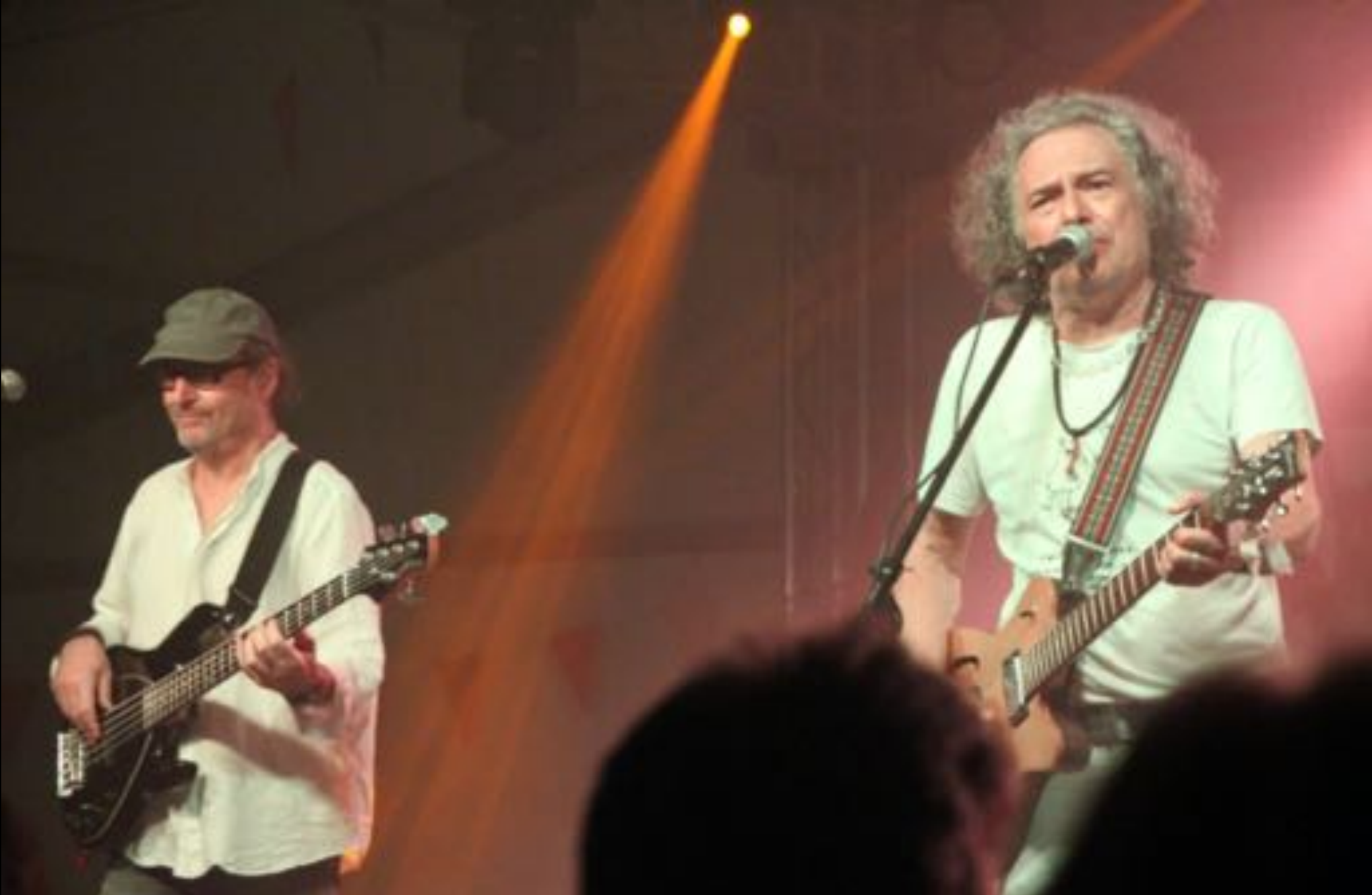
2019. augusztus 16-20. XXIX. Vörösvári Napok programok (KFT koncert)