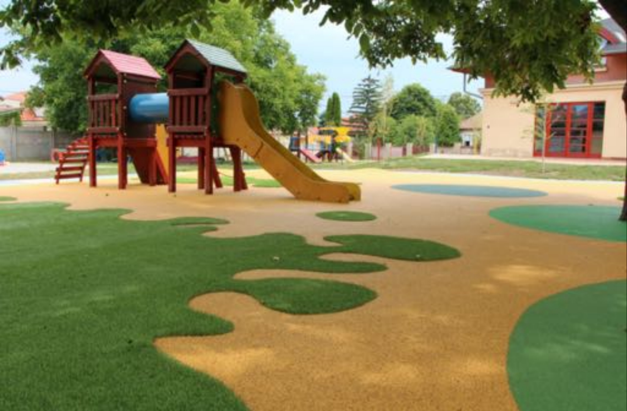
2019. június Szabadság utcai óvoda udvar burkolata (Alapítvánnyal közösen, önrész) 10 000 000Ft