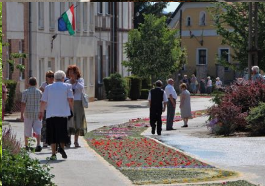
2018. június 3. - Úrnapi körmenet virágszőnyeggel és sátrakkal