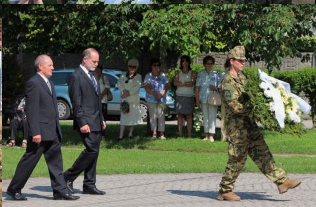
2018. május 27. - Hősök napja