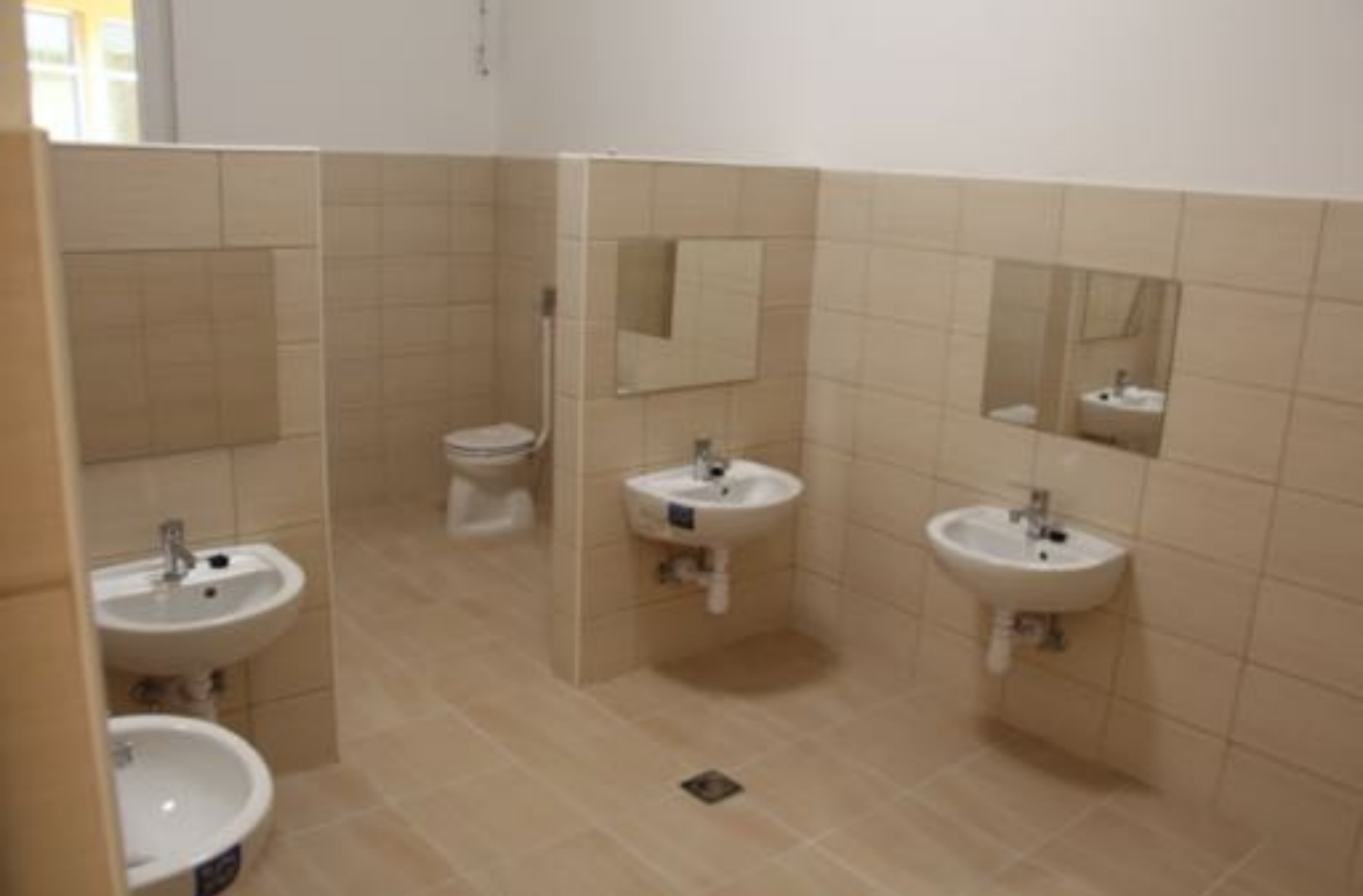
2018.08.08. Zrínyi utcai tornaterem, csoportszoba és gyermek vizesblokk felújítása 11 801 968 Ft