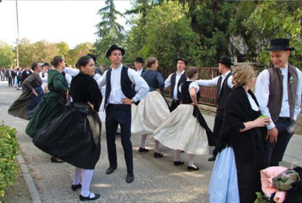
2018. szeptember 29. - Szüreti felvonulás