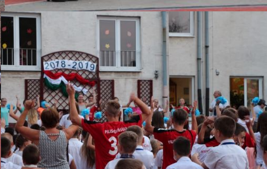
2018 augusztus 31. - Templom téri iskolai évnyitó és udvaravatás