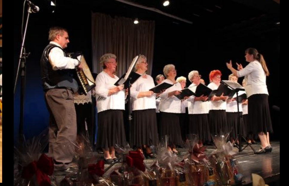
2017. október 8. - Idősek napja