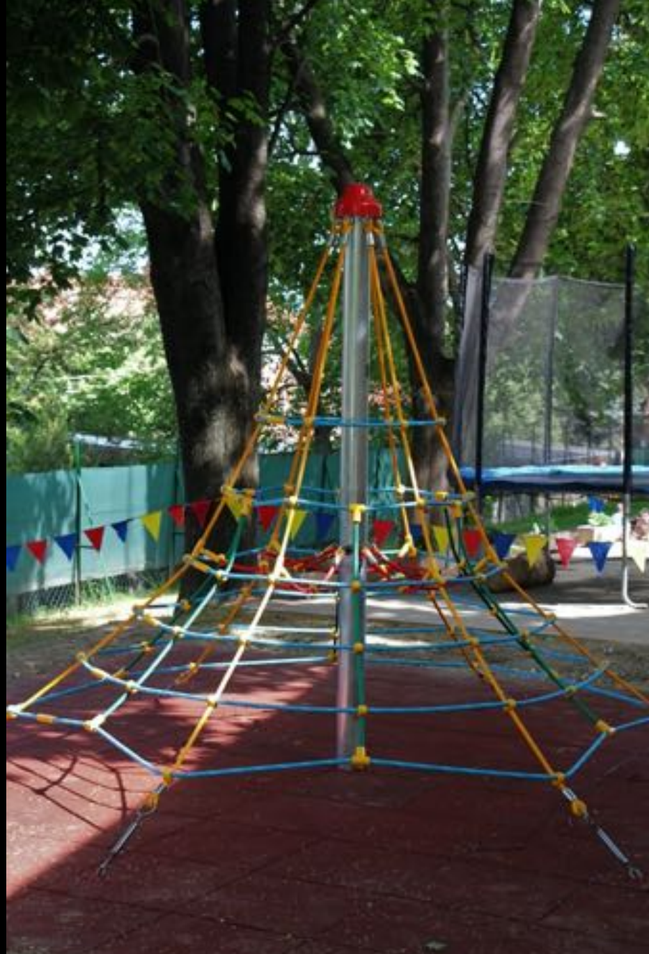
2018.05.02. Kötélpiramis telepítése gumiburkolattal a Széchenyi utcai óvodában 2 618 276 Ft