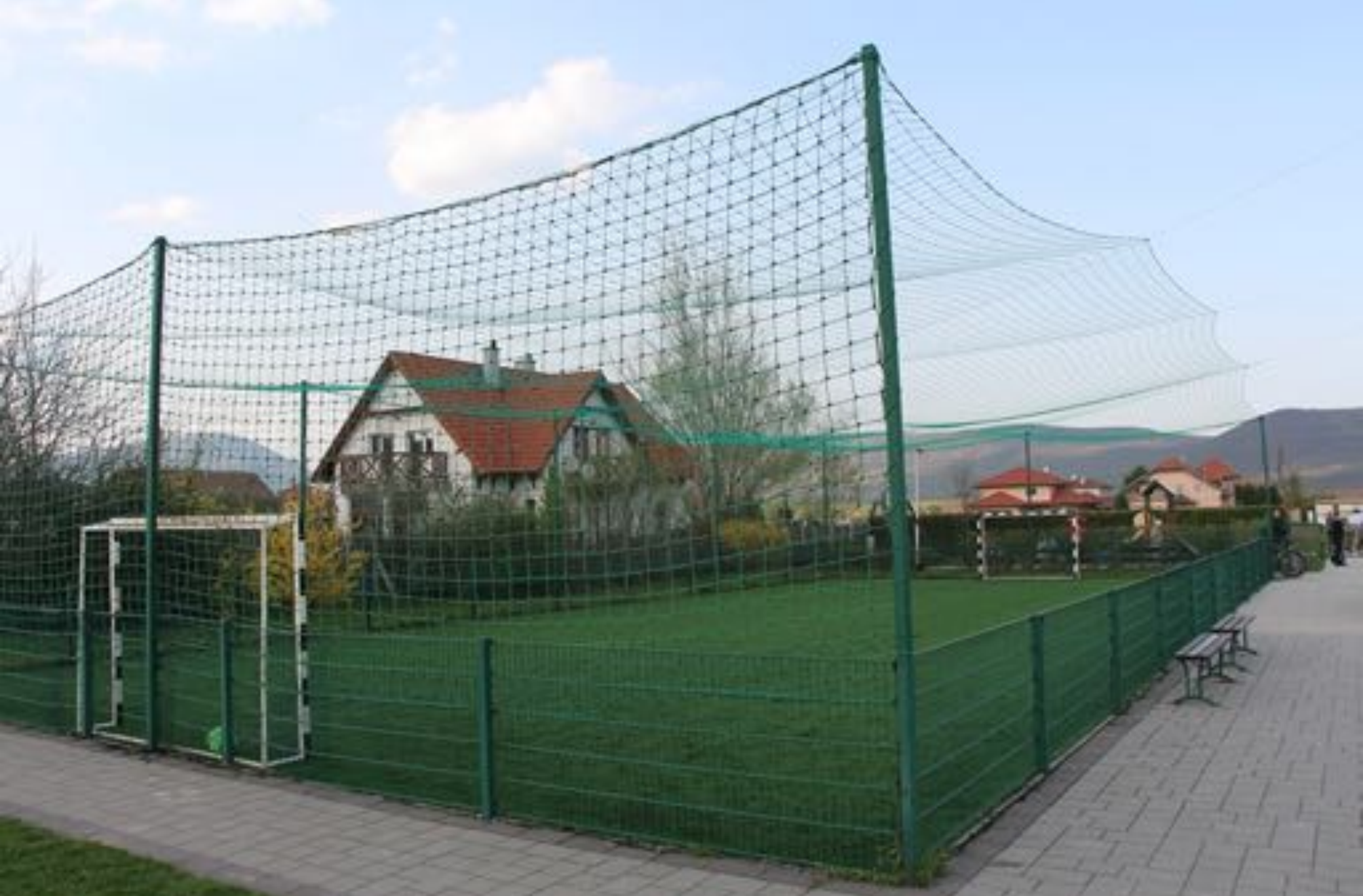
2018.04.17. Műfűszőnyeg és labdafogó hálócseré, kazáncseré a sporttelepen 1 468 200 Ft