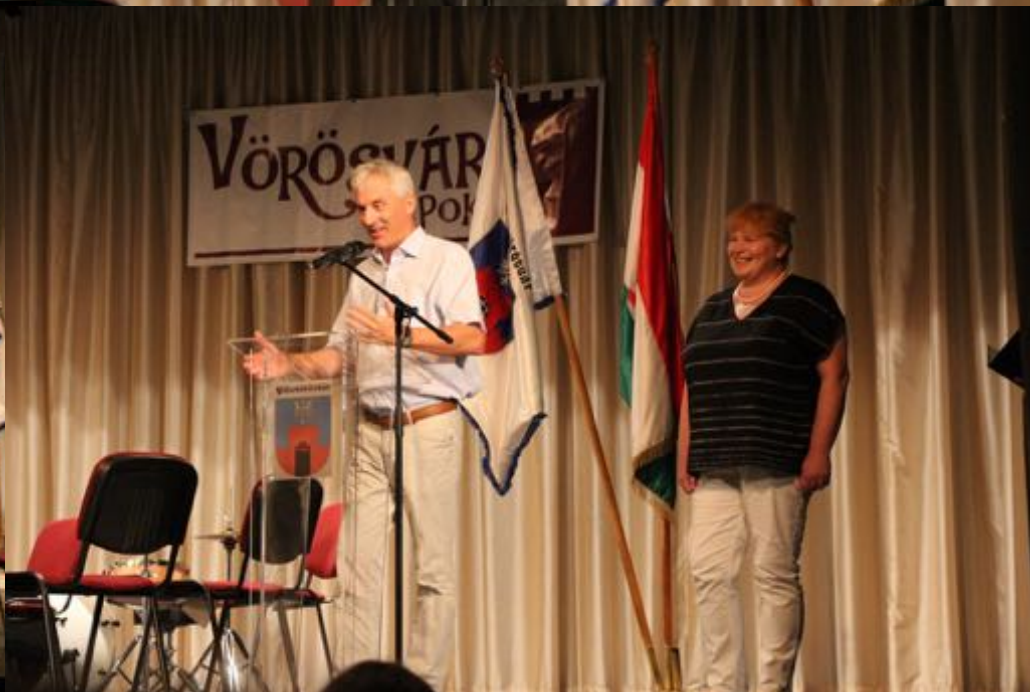
2018. augusztus 10. - XXVII. Vörösvári Napok (megnyitó)