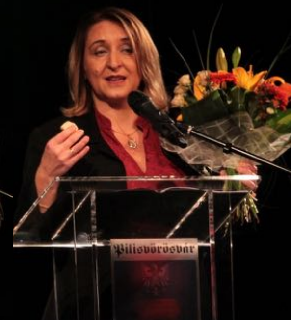
2017. október 23. – Fáklyás felvonulás, városi ünnepség, kitüntettek