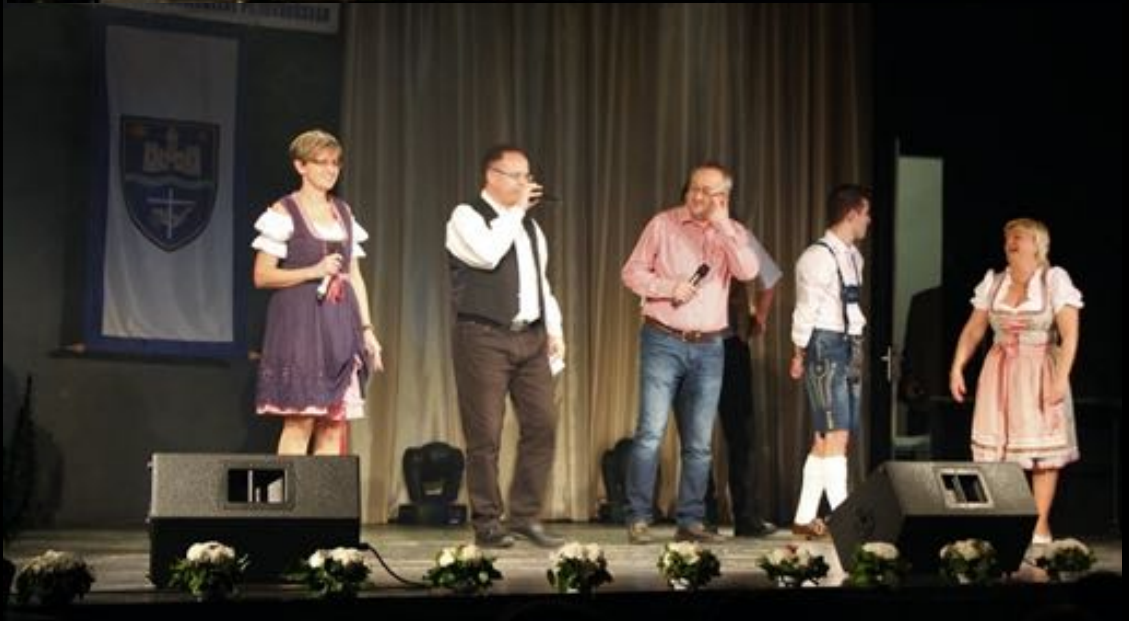
2017. november 19. - Nemzetiségi délután (N.N.Ö. szervezés)