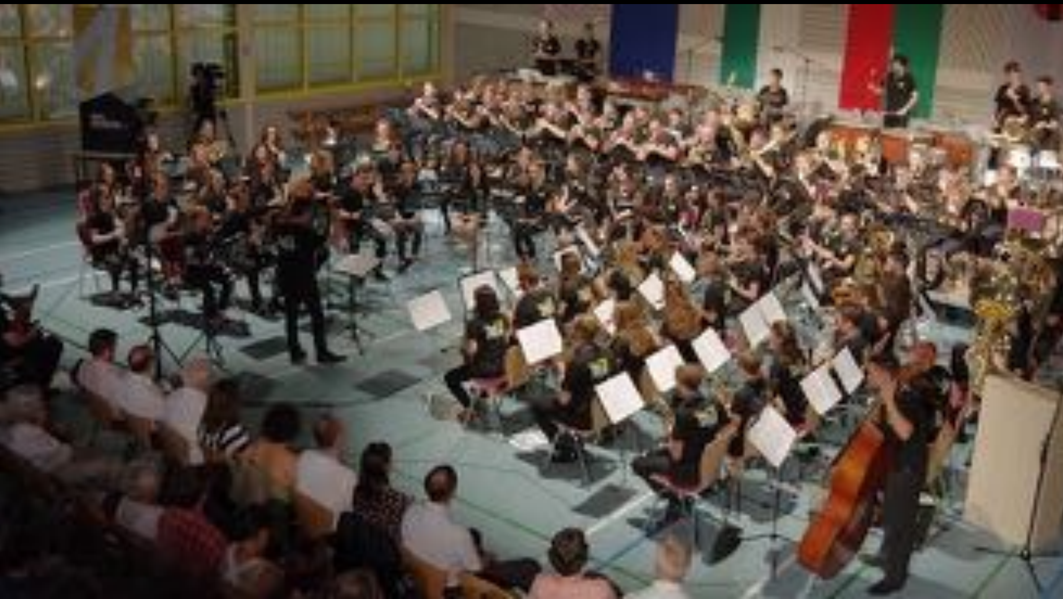
2018. július 22-29. - TRINA Orchestra koncert (Gerstetten)