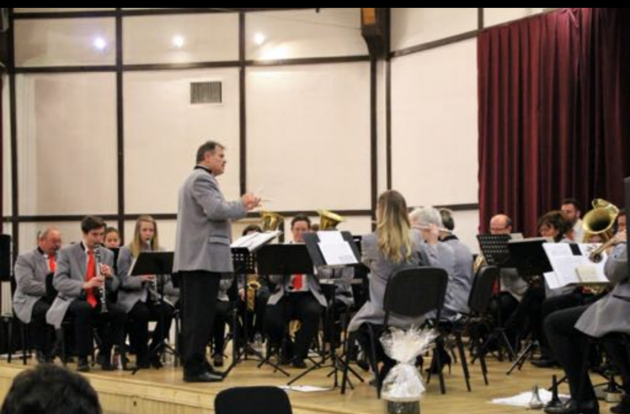
2018. január 1. - Újévi koncert (A Tempo Koncertfúvós Zenekar)