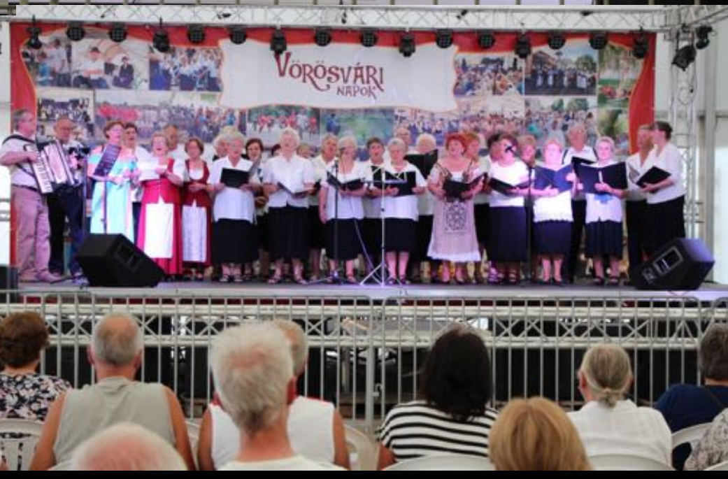
2018. augusztus 10-13. és 18-20. - XXVII. Vörösvári Napok