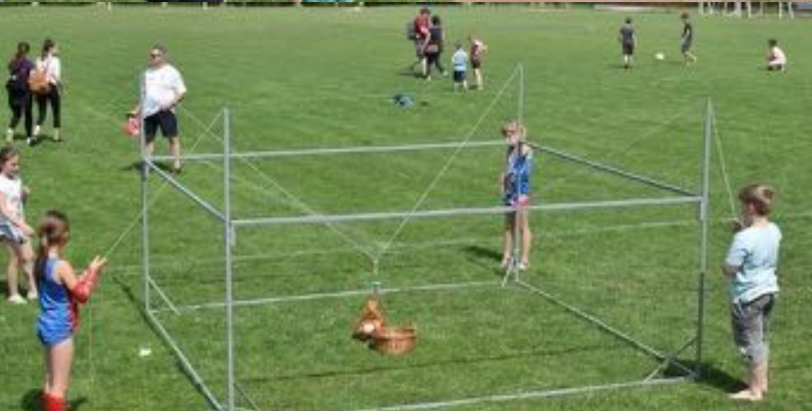
2018. május 1. - Városi Majális a sporttelepen