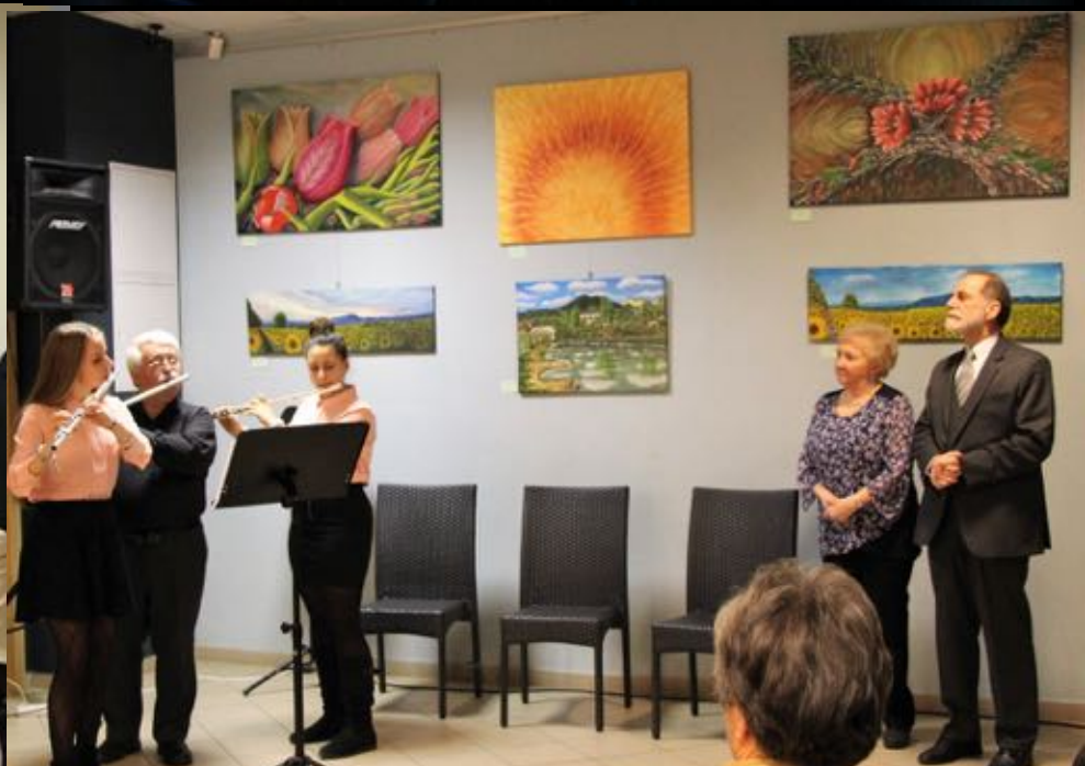
Színházi estek, koncertek, kiállítások, könyvbemutatók, előadások