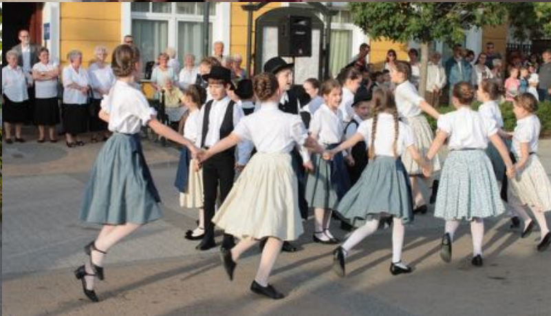
2018. április 30. - Májusfaállítás (N.N.Ö. szervezés)