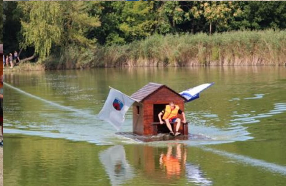
2018. augusztus 20. - XXVII. Vörösvári Napok - XII. Tutajhúzó verseny