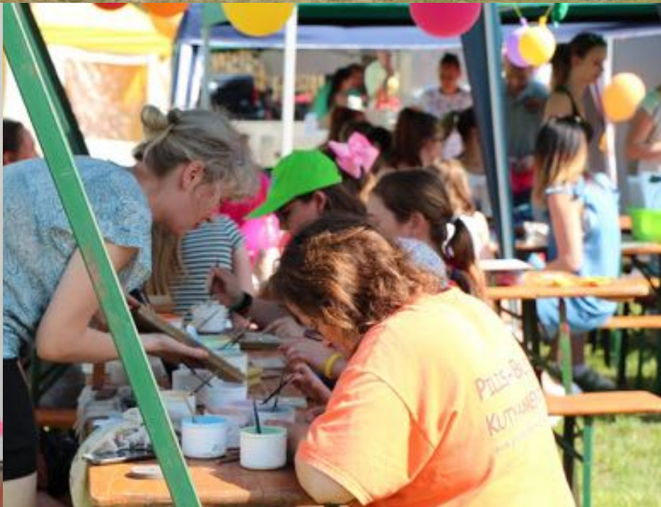
2018. május 27. - Városi Gyermeknap