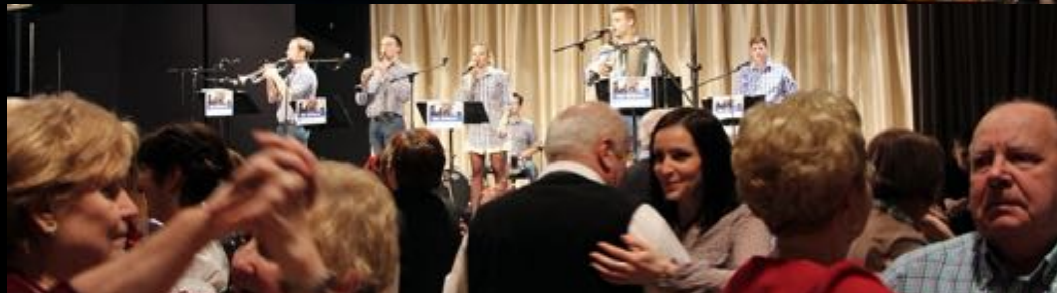
2018. február 13. - Farsangtemetés (N.N.Ö. szervezés)