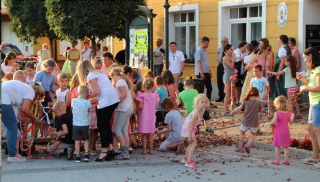
2018. május 31. - Májusfabontás