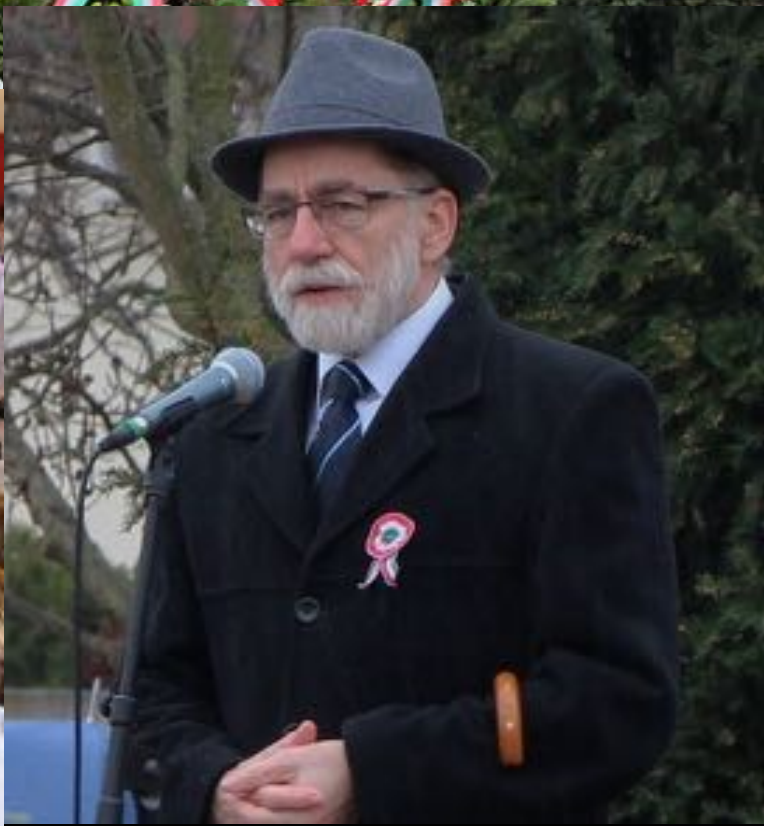
2018. március 15. - Városi ünnepség