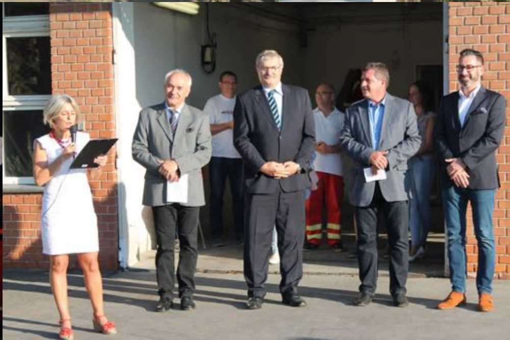
2018. szeptember 15. - 25 éves a Mentőállomás