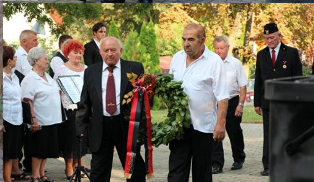
2018. augusztus 31. - Bányásznapi ünnepség