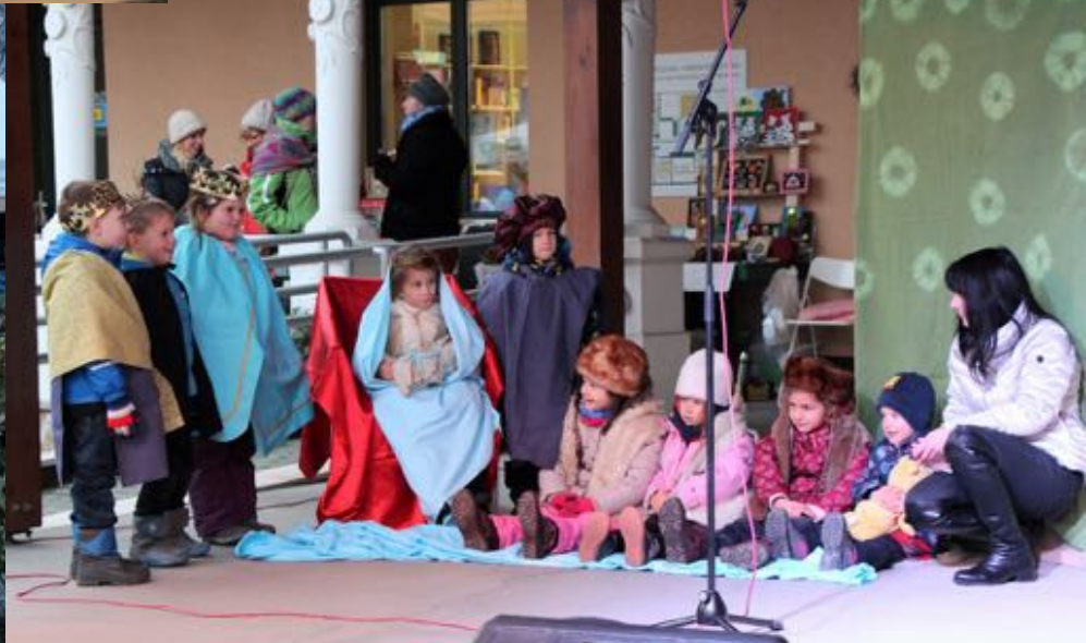
2017. december 10. - Adventi műsor és vásár