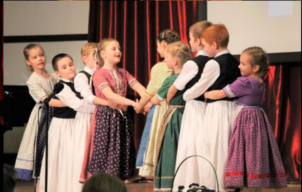
2018. április 20. - V. Művészeti Iskolák Találkozója (a Zeneiskola szervezése)