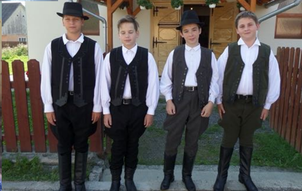
2018. augusztus 1-6. - Vörösvári delegáció a Borszéki Napokon