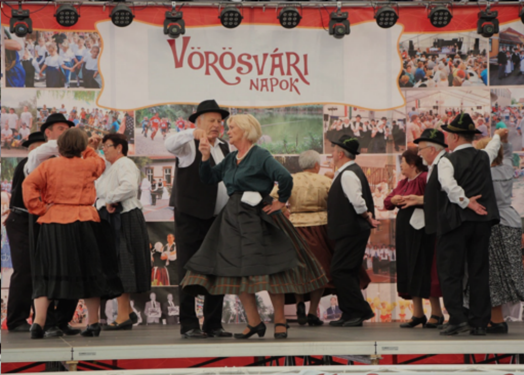
2018. augusztus 12. - XXVII. Vörösvári Napok - Schwabenfest