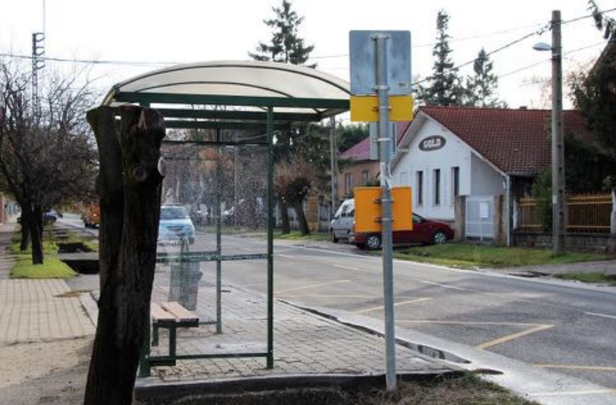
2017.11.hó Szabadság utca - Eperjesi utca sérült buszmegálló javítása és felújítása 216 003 Ft