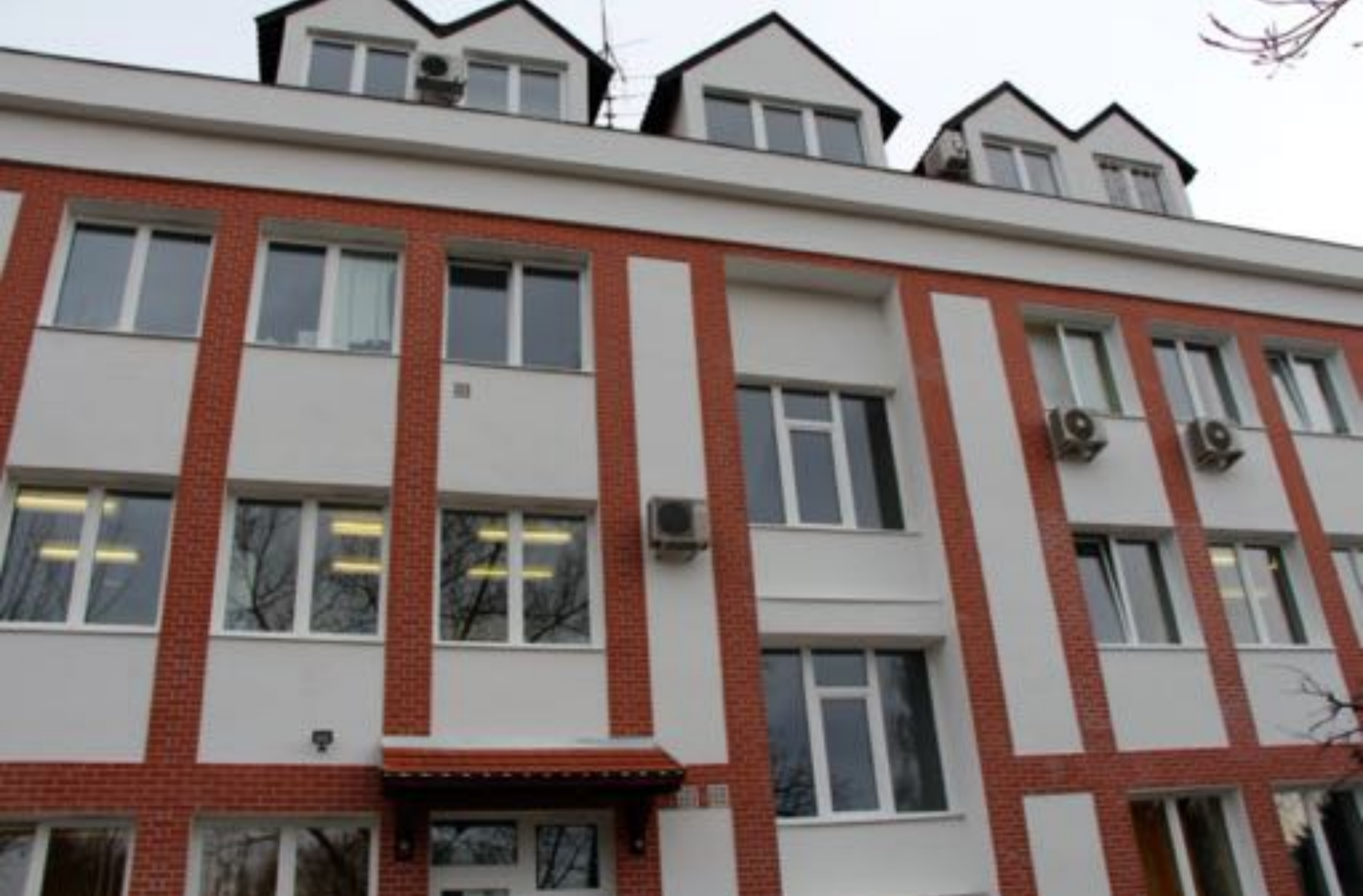
2017.12.11 Szakorvosi Rendelő energetikai korszerűsítése 49 205 512 Ft