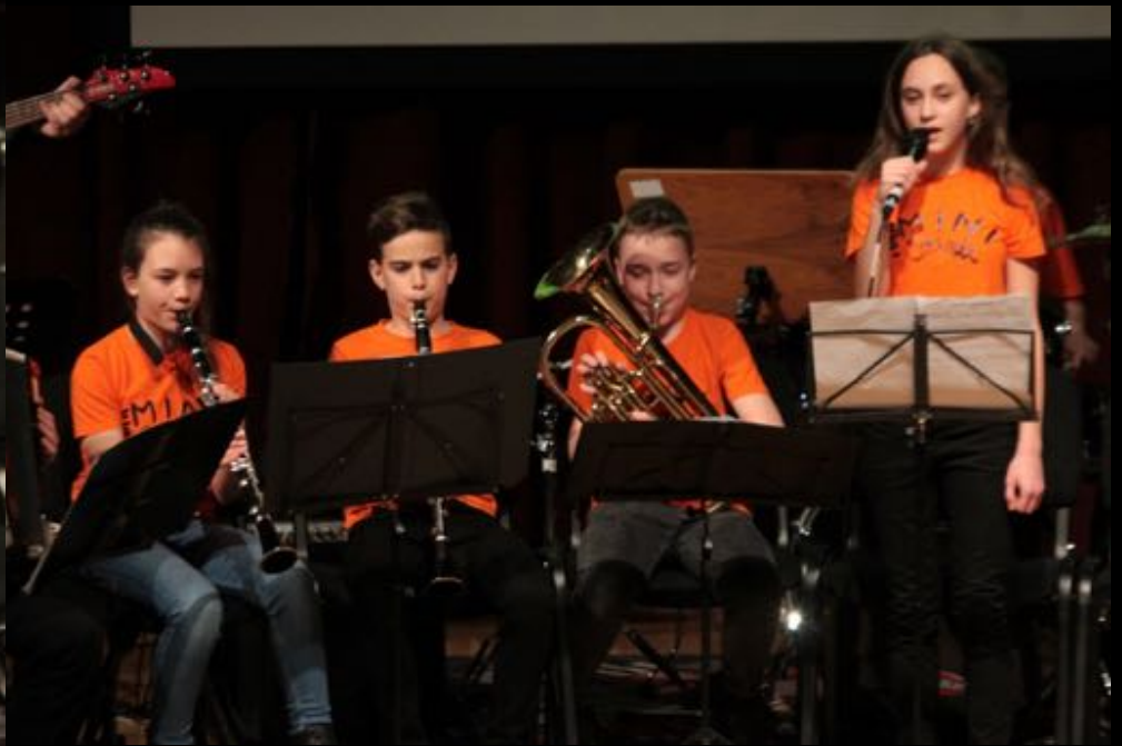
2018. március 24. - VI. Pilisi Ifjúsági Fúvóstadálkozó (a Zeneiskola szervezése)