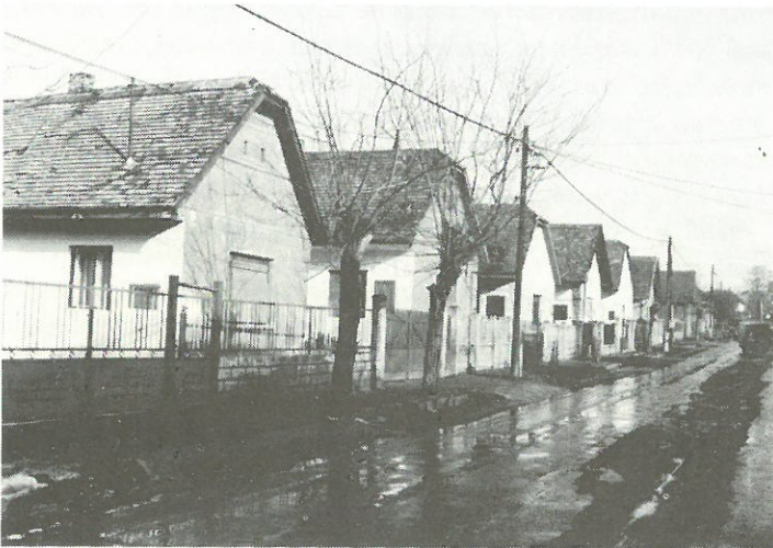
Vörösvárról, napfényben a Dózsa Gy. út