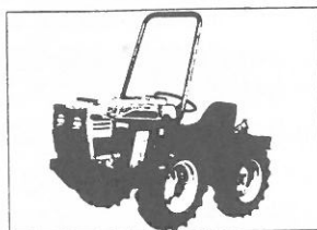
Grillo 31 V 28 Le

PILISVÖRÖSVÁR Fő út 117-119 Tel.: 30-372