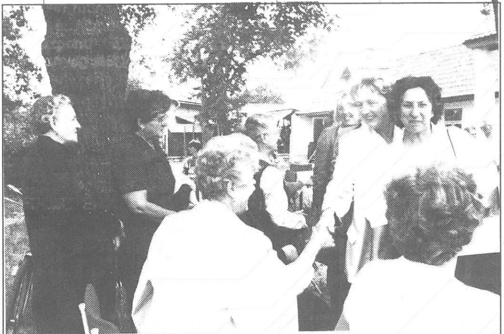
Vendégek a tájház avatásán